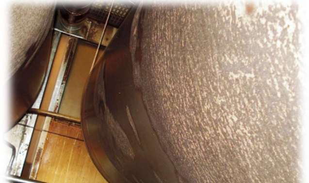
Lähtötilanne: Erittäin likaiset sylinterit

Puhdistustulokseen tehtaalla ollaan tyytyväisiä. EV ReDocilla sylinterien ja kalanterin pinnoilta on saatu poistettua niihin vuosien saatossa pinnittynyt lika. Puhtaiden sylinteripintojen ansiosta haihdutus on tehostunut, kuivatus vie aiempaa vähemmän energiaa ja kartongin laatu on parantunut. Puhdistetut pinnat eivät ole likaantuneet merkittävästi uudelleen kuluneen vuoden aikana.