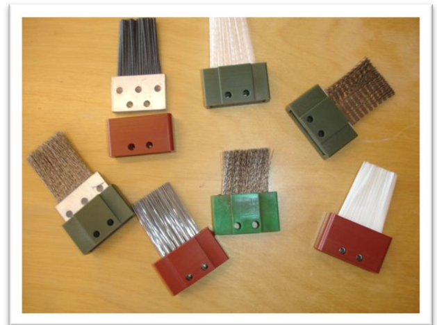
EV ReDoc järjestelmän harjatyyppejä

EV ReDocin sähkön kulutus on nimellistä, sillä harjoja ja ketjua kuljettaa 0.18 kW:n moottori.